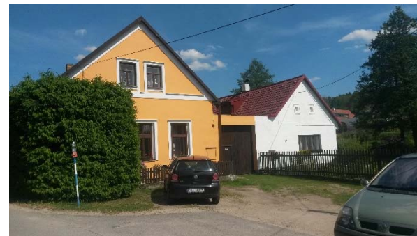
Foto současného stavu domu